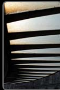
No. : 16 Réf. : 070430_05 Prix: 380.-