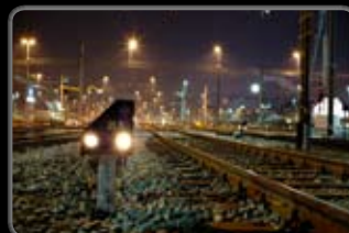
No. : 20 Réf. : 060318_68 Prix: 380.-