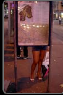
No. : 12 Réf. : 060617_06 Prix: 380.-