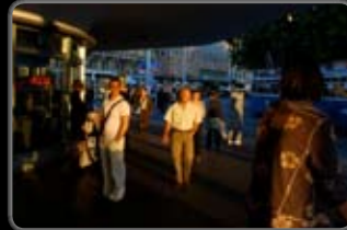
No. : 18 Réf. : 060920_16 Pas en vente