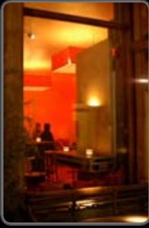
No. : 11 Réf. : 060315_33 Prix: 380.-