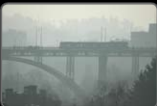
No. : 19 Réf. : 060318_31 Prix: 380.-