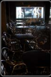
No. : 13 Réf. : 060924_19 Prix: 380.-