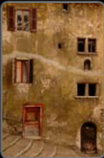
No. : 15 Réf. : 060526_08 Prix: 380.-