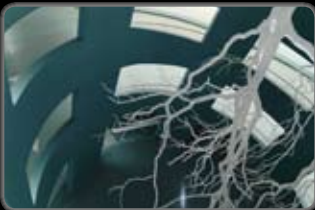
No. : 17 Réf. : 040617_09 Prix: 380.-