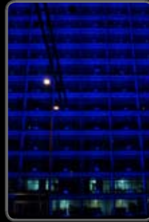
No. : 14 Réf. : 060924_03 Prix: 380.-